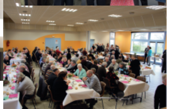
Le repas des Anciens Combattants