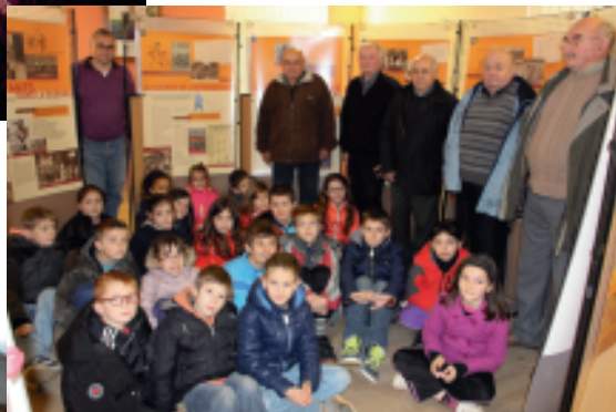
L'exposition sur la guerre 14-18