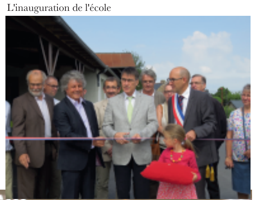
L'inauguration de l'école