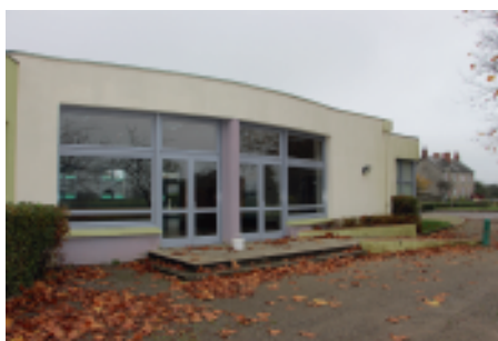
Un container pour verres et papier a été installé à proximité.

Les tarifs et les conditions de location ont été revus. La salle peut être louée pour 1 journée (soit de 9h à 9h le lendemain, soit de 16h à 16h le lendemain) ou pour un week-end (du vendredi 16h au lundi 9h). La location se fait « tout compris » : avec la cuisine et avec la vaisselle pour 100 personnes (possibilité de plus sur demande). Il y aura toujours des tarifs différents pour les Saulniérois et pour les habitants d'autres communes. Les tarifs seront appliqués à partir du 1er janvier.