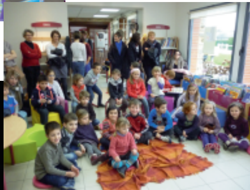
L'animation tapis conté