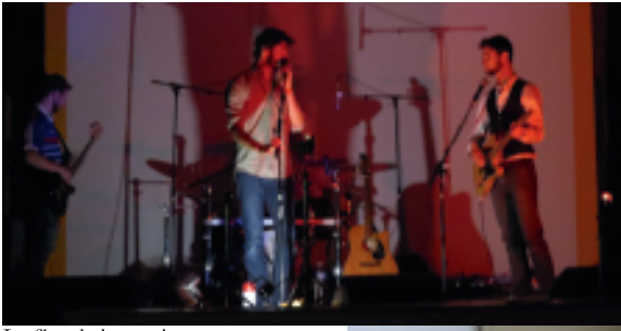
La fête de la musique