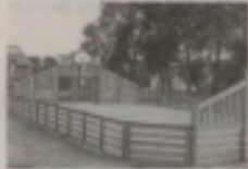
L'équipement multiport dont pourront disposer les enseignants.

Le déménagement s'est déroulé durant les vacances de février, mais l'inauguration officielle avait lieu. Satisfaction unanime après quelques semaines d'usage.