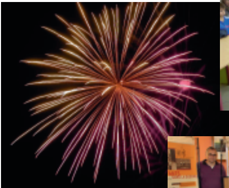
Le feu d'artifice